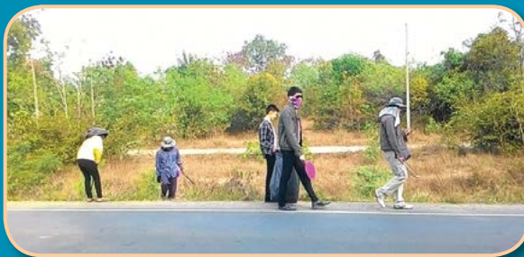
โครงการจัดกิจกรรม Big Cleaning Day