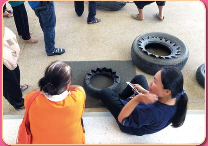
โครงการระยะรีโซเคิล