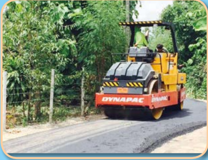
โครงการก่อสร้างถนนลาดยาง บ้านหนองแก่น ชอย ๑๕