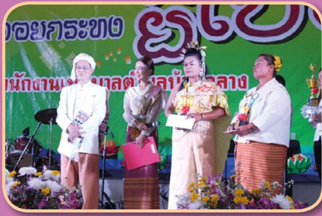
โครงการจัดกิจกรรมประเพณีวันลอยกระทง