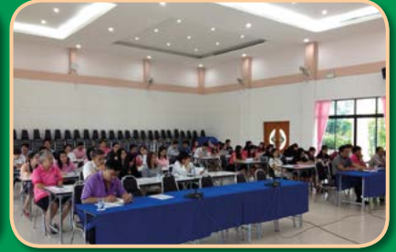
โครงการฝึกอบรมพัฒนาบุคลากรพนักงานเทศบาล ครู และบุคลากรทางการศึกษา