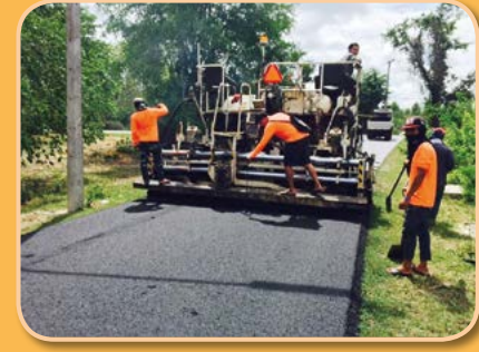
โครงการก่อสร้างถนน คสล. ซอยบ้านนายจรัส บ้านหนองไถ่น