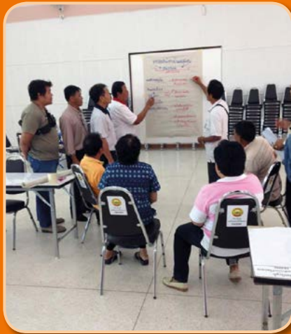
โครงการอบรมสัมมนาและทัศนศึกษาดูงาน สมาชิกสภาฯ ทำนบผู้ใหญ่บ้านและผู้นำชุมชน