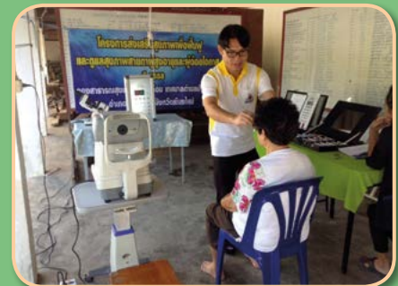
โครงการส่งเสริมสุขภาพเพื่อฟื้นฟู และดูแลสุขภาพสายตาผู้สูงอายุและผู้ด้อยโอกาส