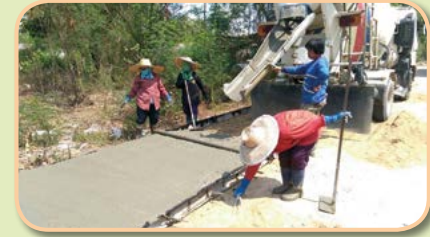
โครงการก่อสร้างถนน คสล. ซอยบ้านนายจรัส บ้านหนองไถ่น