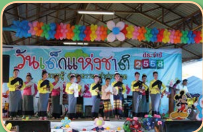
โครงการจัดกิจกรรมวันเด็กแห่งชาติ ประจำปี ๒๕๕๘