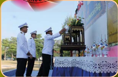
โครงการจัดกิจกรรมวันพ่อแห่งชาติ