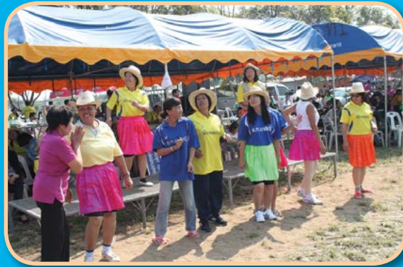
โครงการจัดกิจกรรมคืนความสุขแก่ประชาชน