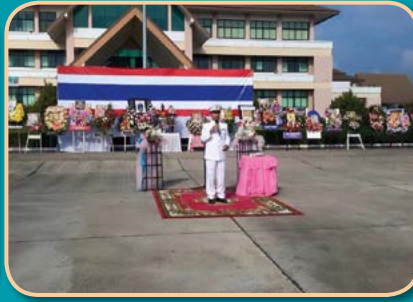
โครงการจัดกิจกรรมวันปิยะมหาราช