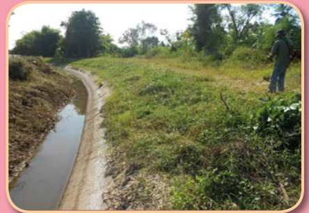
โครงการคลองสวยน้ำใส