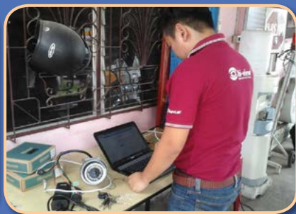
โครงการติดตั้งกล้องวงจรปิด