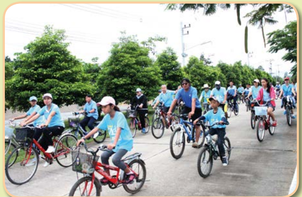
โครงการปั่นเพื่อแม่