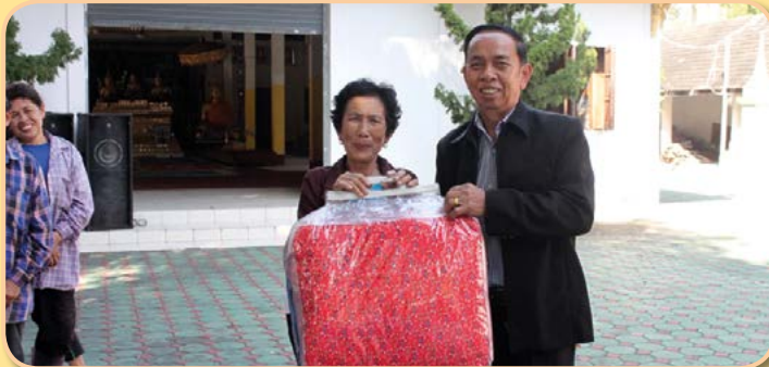
โครงการให้ความช่วยเหลือผู้ยากไร้