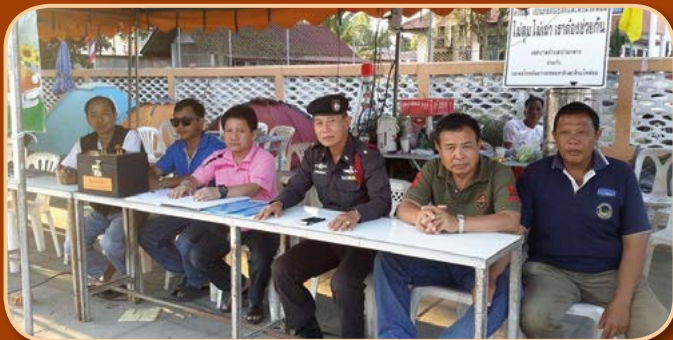
โครงการอำนวยความสะดวกด้านการจราจร และอุบัติเหตุช่วงเทศกาลสงกรานต์