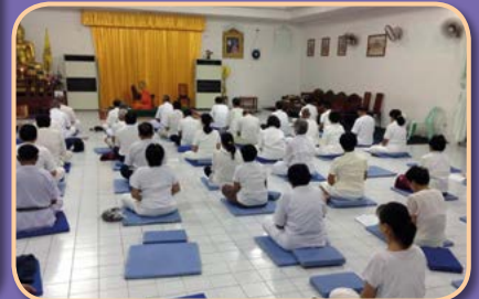
โครงการธรรมส่งเสริมคุณภาพชีวิตผู้สูงอายุ สุขกาย สุขใจ